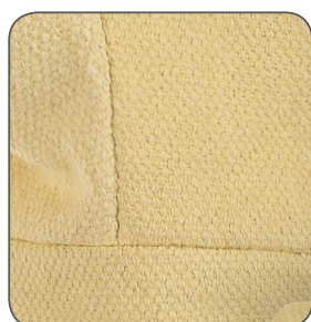
aramidová tkanina aramid cloth włóknina aramidowa